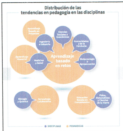
Tabla 1. Tendencias en pedagogía desde la prospectiva general.